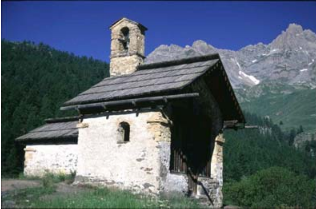
Chapelle de Fontcouverte

MODALITES ET PRIX DE LA LOCATION : mois de juillet et août : 750 euros par semaine