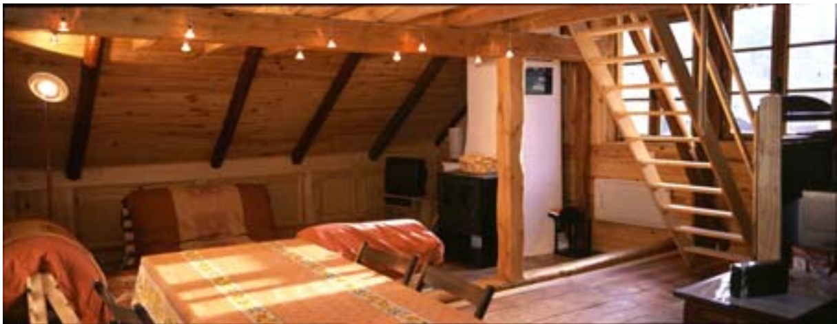
Coin dîner et coin salon : en fin de journée, le soleil illumine toute la pièce.

- 3 ème niveau : sous la poutre faîtière ! ..... une rochelle plus de 10 m 2 utilisables : si vous êtes matinal, on peut voir les couleurs du lever du soleil sur les cimes.